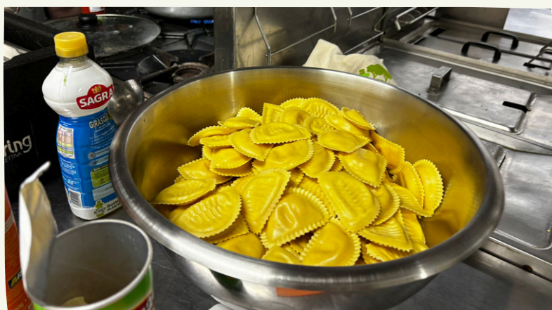
CIMPUNDA CUCINA PASTI CALDI PER IL DORMITORIO IN VIA VOLTA