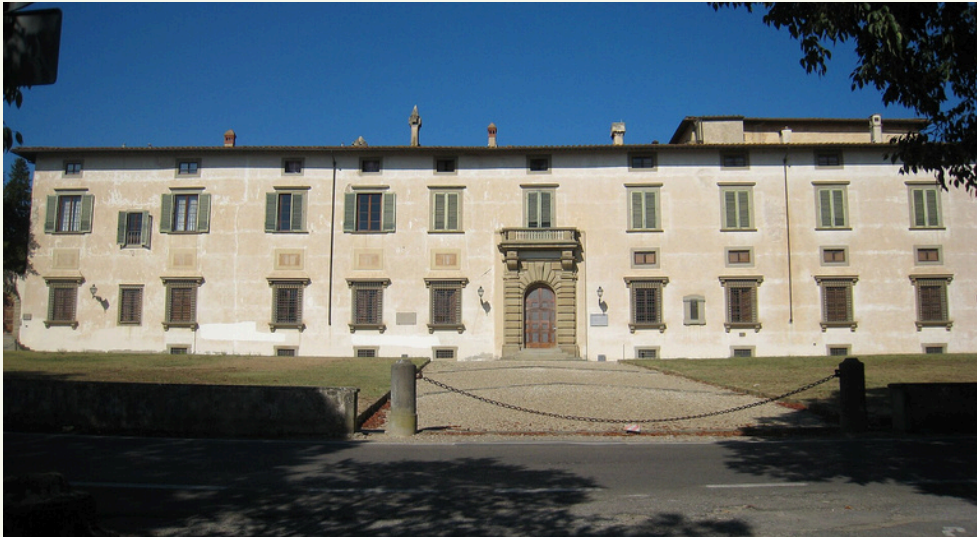
ACCADEMIA DELLA CRUSCA

L'italiano ha due generi grammaticali, il maschile e il femminile (ma avrebbero potuto benissimo chiamarsi Gruppo X e Gruppo Y, e io non sarei qui a scrivere quest'articolo) e dobbiamo prenderne atto senza rimanere con l'amaro in bocca.